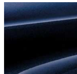
KOLOR LAKIERU: Sphere Blue Pearl (ZQ4)